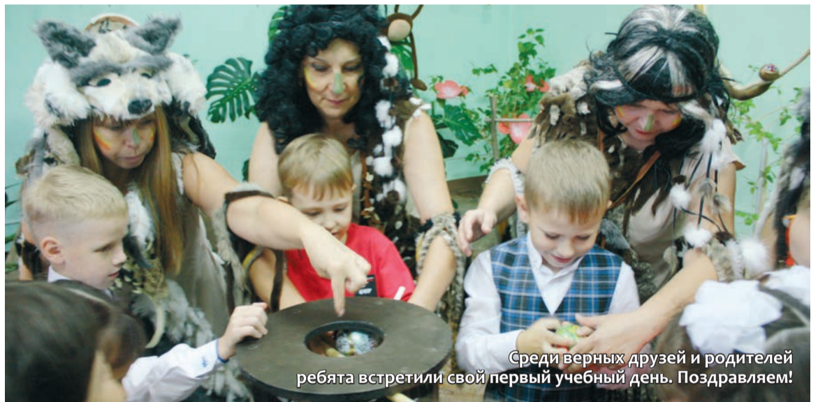
Среди верных друзей и родителей ребята встретили свой первый учебный день. Поздравляем!