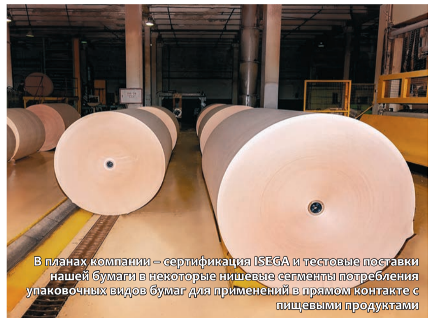
В планах компании – сертификация ISEGA и тестовые поставки нашей бумаги в некоторые нишевые сегменты потребления упаковочных видов бумаг для применений в прямом контакте с пищевыми продуктами