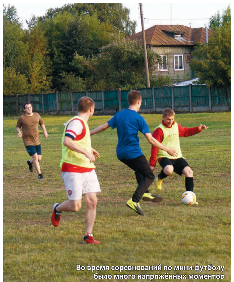
Во время соревнований по мини-футболу было много напряжённых моментов