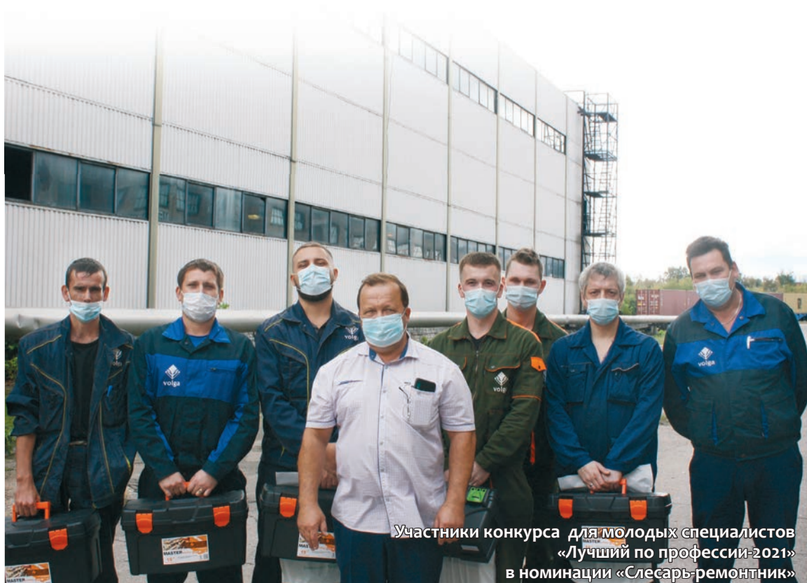
Участники конкурса для молодых специалистов «Лучший по профессии-2021» в номинации «Слесарь-ремонтник»

Все участники получили памятные подарки, а победители получают надбавки к должностному окладу в течение года. Поздравляем призеров с заслуженной победой, а также желаем всем участникам удачи в следующем году!