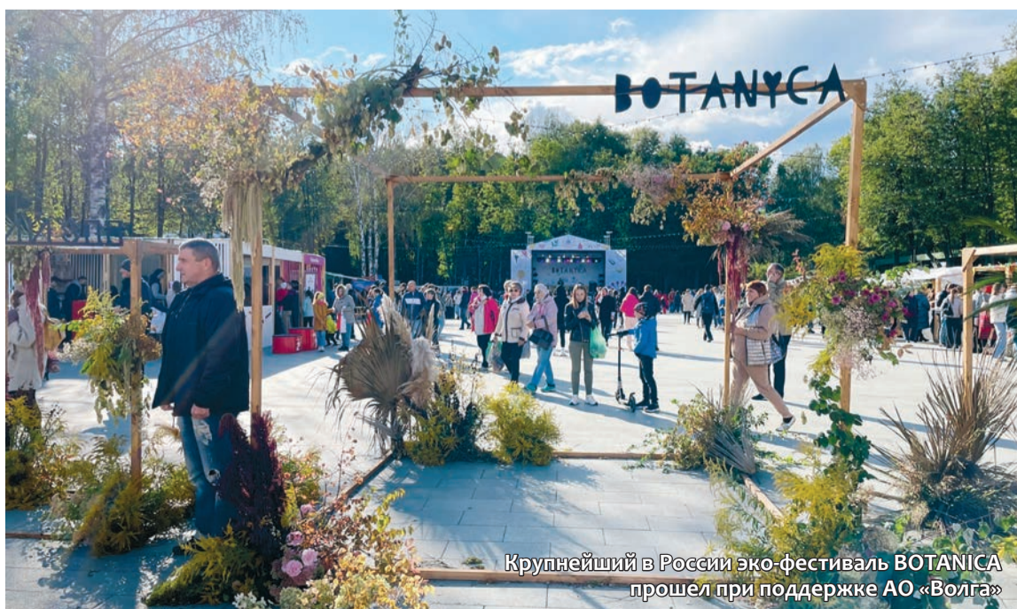
Крупнейший в России эко-фестиваль BOTANICA прошел при поддержке АО «Волга»