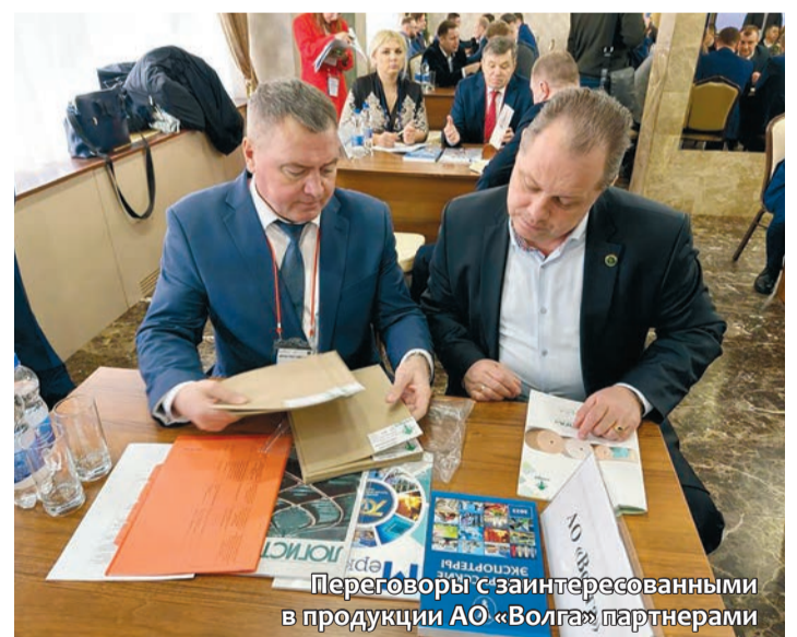
Переговоры с заинтересованными в продукции АО «Волга» партнерами

Кроме того, представители АО «Волга» посетили ООО «За-