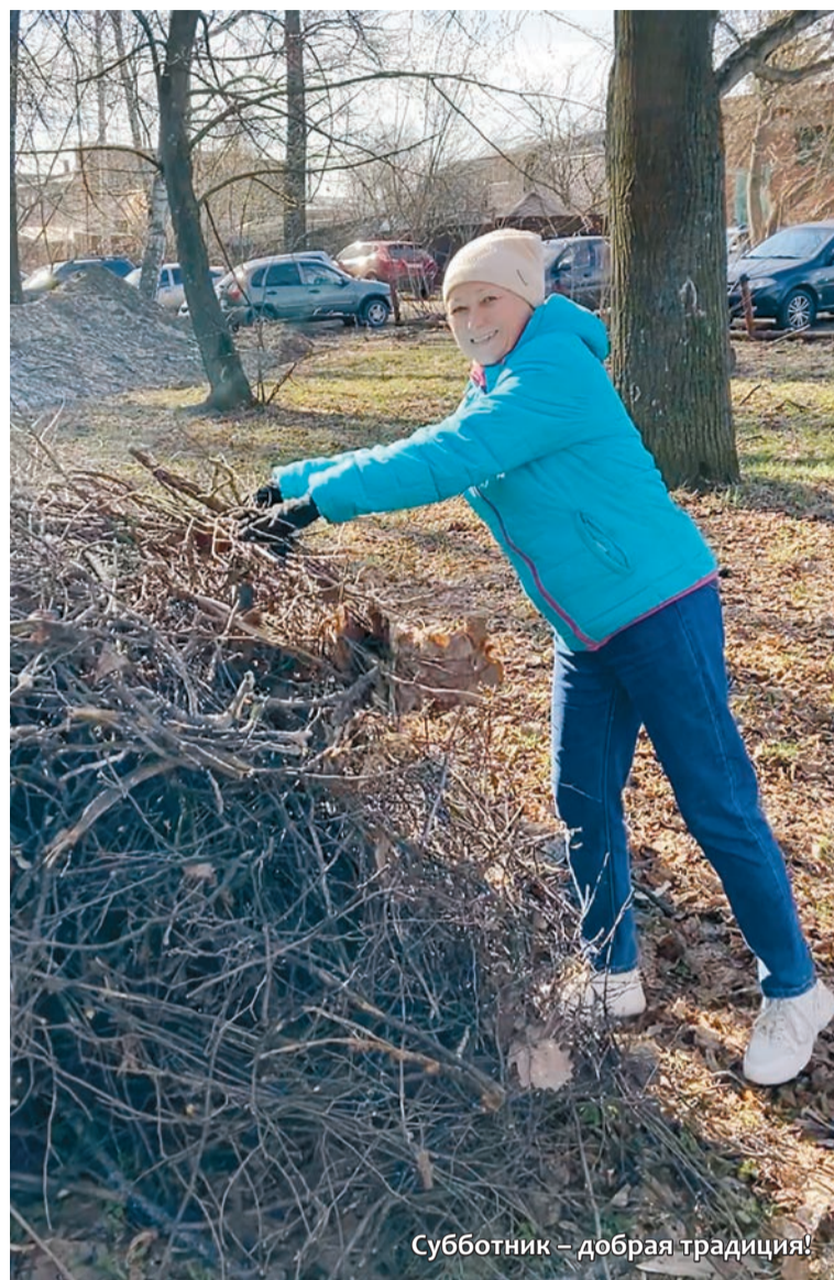
Субботник – добрая традиция!

Теперь каждый сотрудник АО «Волга» может видеть результат труда наших активистов. Мы выражаем им благодарность, и надеемся, что каждый из нас будет сохранять чистоту на территории предприятия!