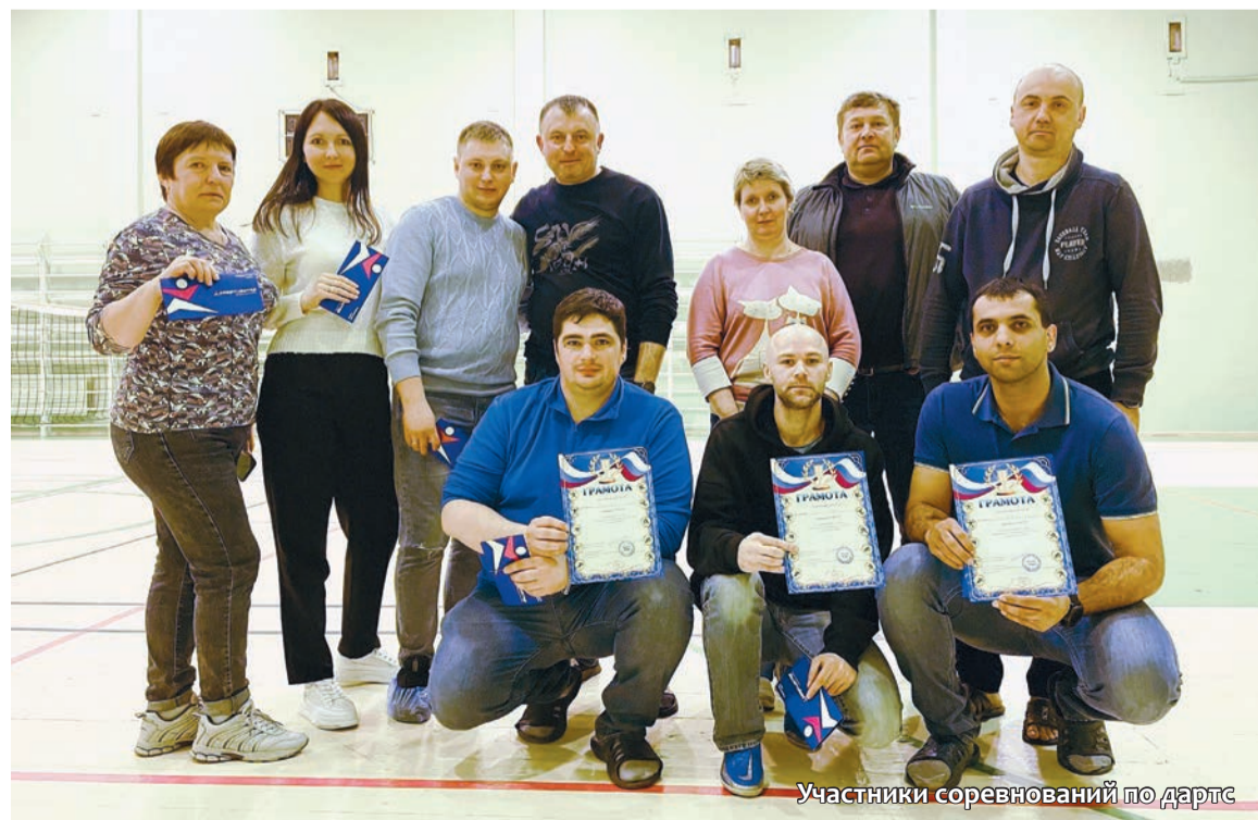
Участники соревнований по дартсу

дились соревнования по волейболу. Финальная игра подарила нам следующий результат: первое место – «Трио Волга» 8 очков, второе место «Сборная Мира» 6 очков, третье место – «Управление» 5 очков, четвертое место – «Paper Machine» 2 очка и, соответственно, пятое