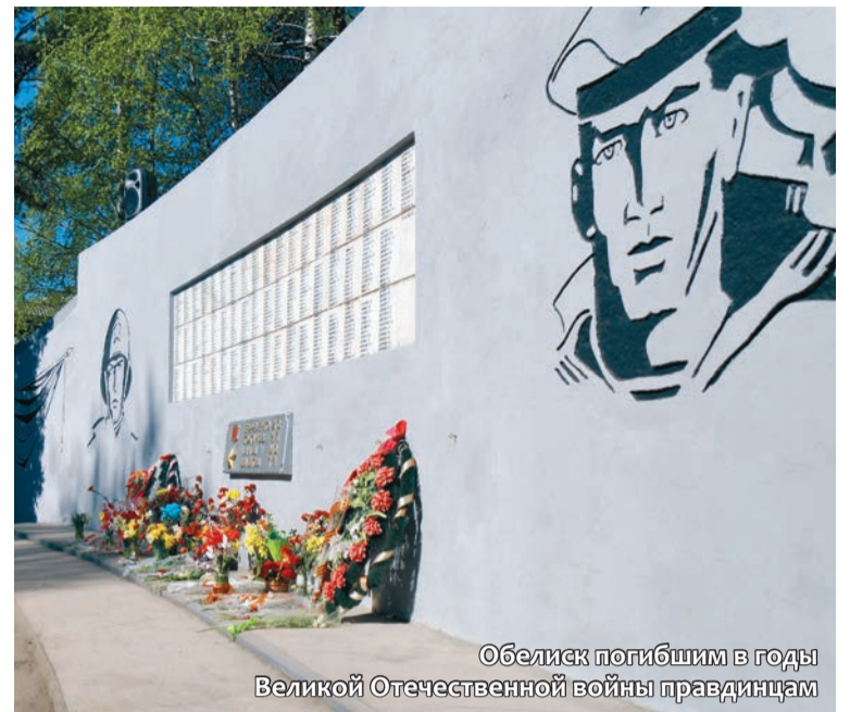
Обелиск погибшим в годы Великой Отечественной войны правдинцам

Несмотря на то и дело возникающие сложности из-за низкого качества топлива, изношенности