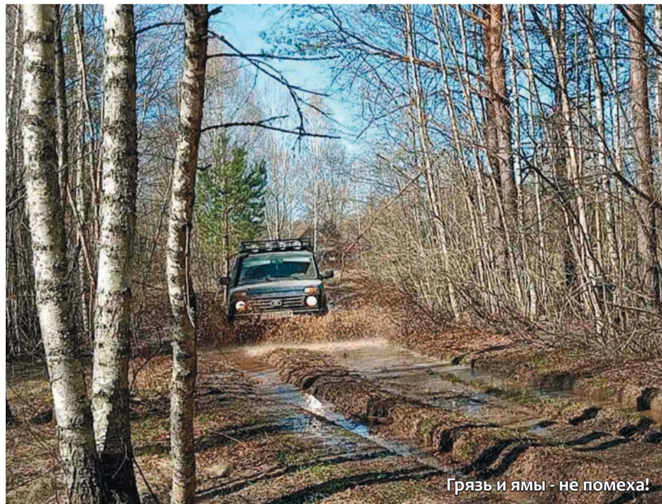
Грязь и ямы - не помеха!