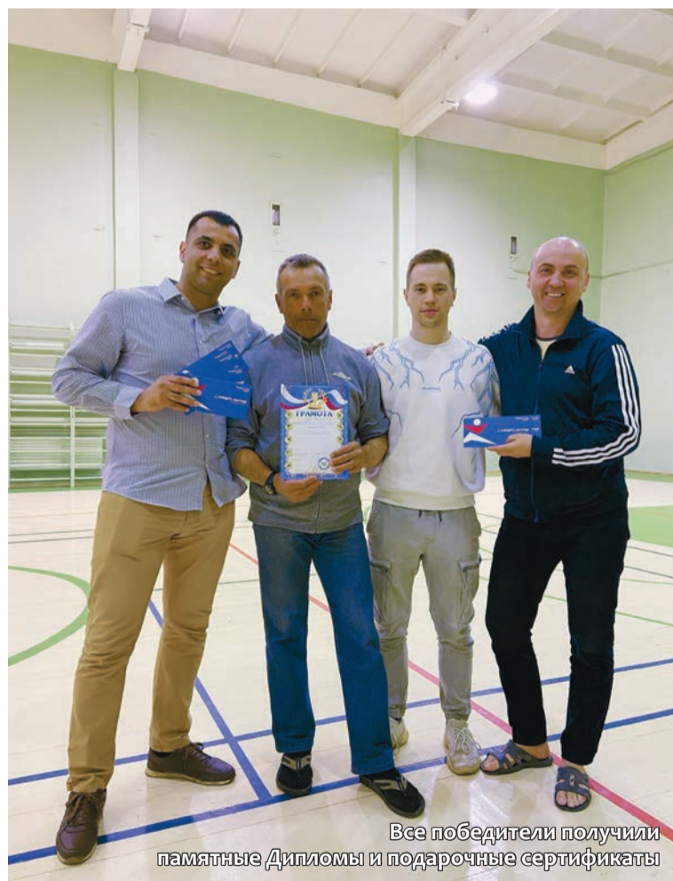
Все победители получили памятные Дипломы и подарочные сертификаты

место – «Энергия». Все спортсмены показали достойный уровень игры и отличную командную работу.