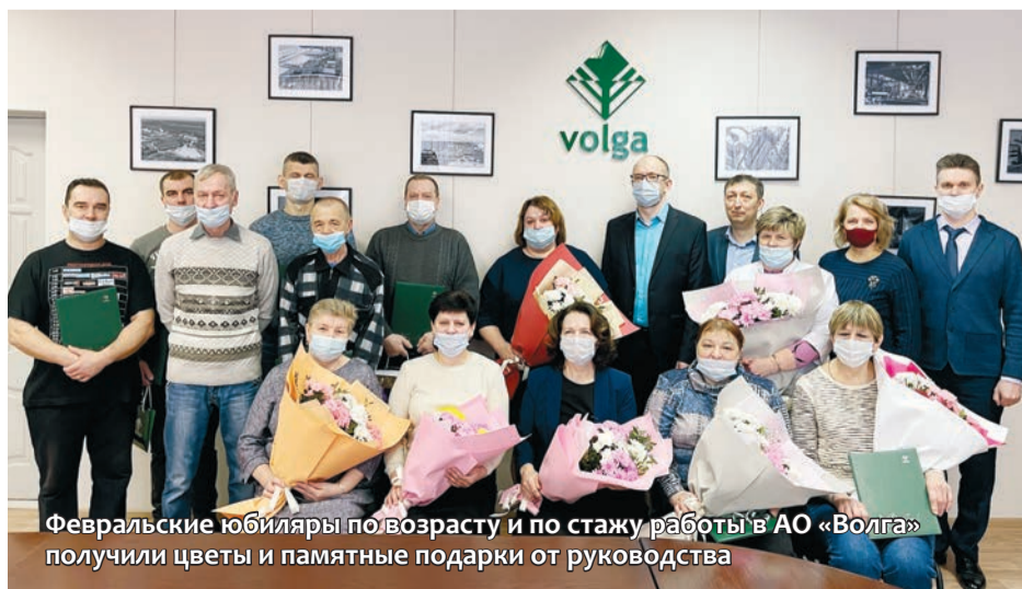
Февральские юбиляры по возрасту и по стажу работы в АО «Волга» получили цветы и памятные подарки от руководства

Такие мероприятия уже стали доброй традицией на нашем предприятии: в течение года все юбиляры, отдавшие работе в АО «Волга» не менее 10 лет, будут отмечены поздравительными адресами и подарками.