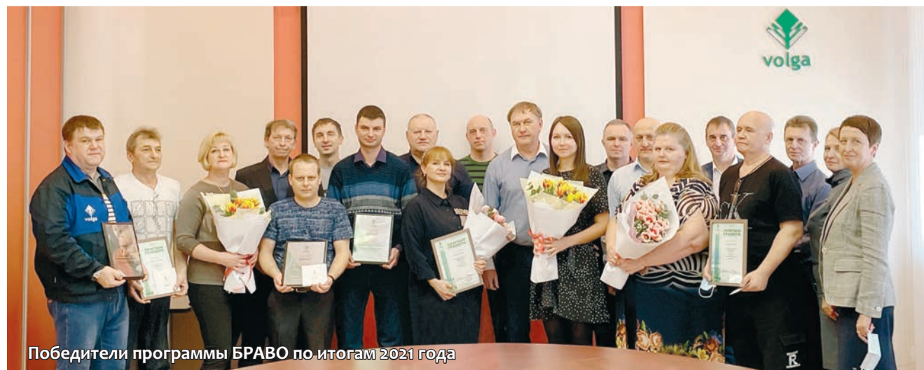
Победители программы БРАВО по итогам 2021 года

Напоминаем, что в 2022 году программа БРАВО продолжается и будет расширена новыми номинациями.