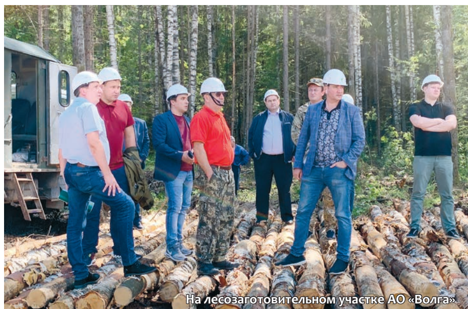
На лесозаготовительном участке АО «Волга»