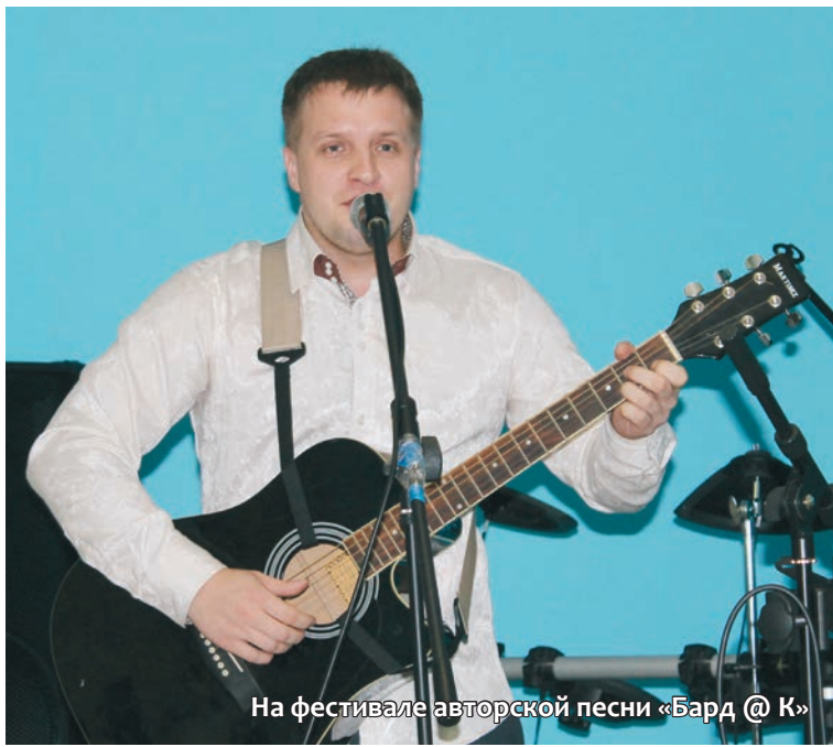
На фестивале авторской песни «Бард @ К»