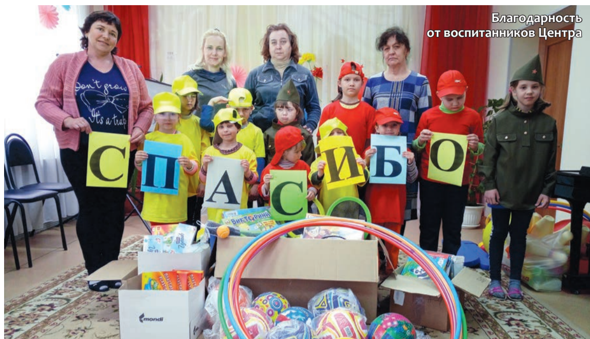
Благодарность от воспитанников Центра

В День защиты детей администрация АО «Волга» по доброй традиции оказывает благотворительную помощь ребятам «Социально-реабилитационного центра для несовершеннолетних Балахнинского района». И этот год не стал исключением.