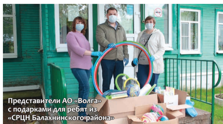
Представители АО «Волга» с подарками для ребят из «СРЦН Балахнинского района»

Представители отдела по социальным программам АО «Волга» и Независимой профсоюзной организации работников предприятия поздравили с праздником воспитанников Центра и передали подарки для развития творческих способностей: раскраски, бумагу, настольные игры, канцелярские товары. Для досуга на свежем воздухе были приобретены скакалки, обручи, инвентарь для игры в бадминтон, футбольные мячи и многое другое.