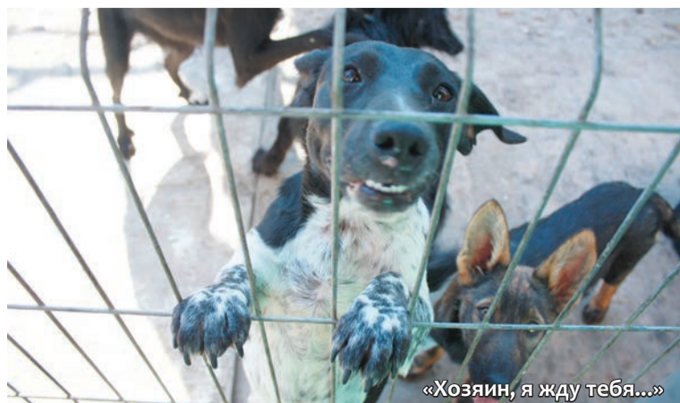
«Хозяин, я жду тебя...»

Пристрой животных в семьи идет, но к сожалению, не так быстро. Однако стоит отметить, что весь состав подопечных собак и кошек с начала существования приюта обновился.