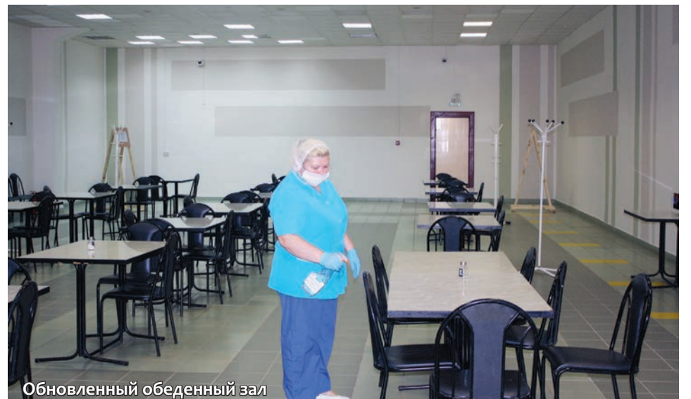
Обновленный обеденный зал

Отметим, что все ремонтные работы были выполнены в срок и уже по достоинству оценены посетителями столовой.