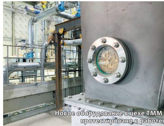
Новое оборудование в цехе ТММ протестировано в работе