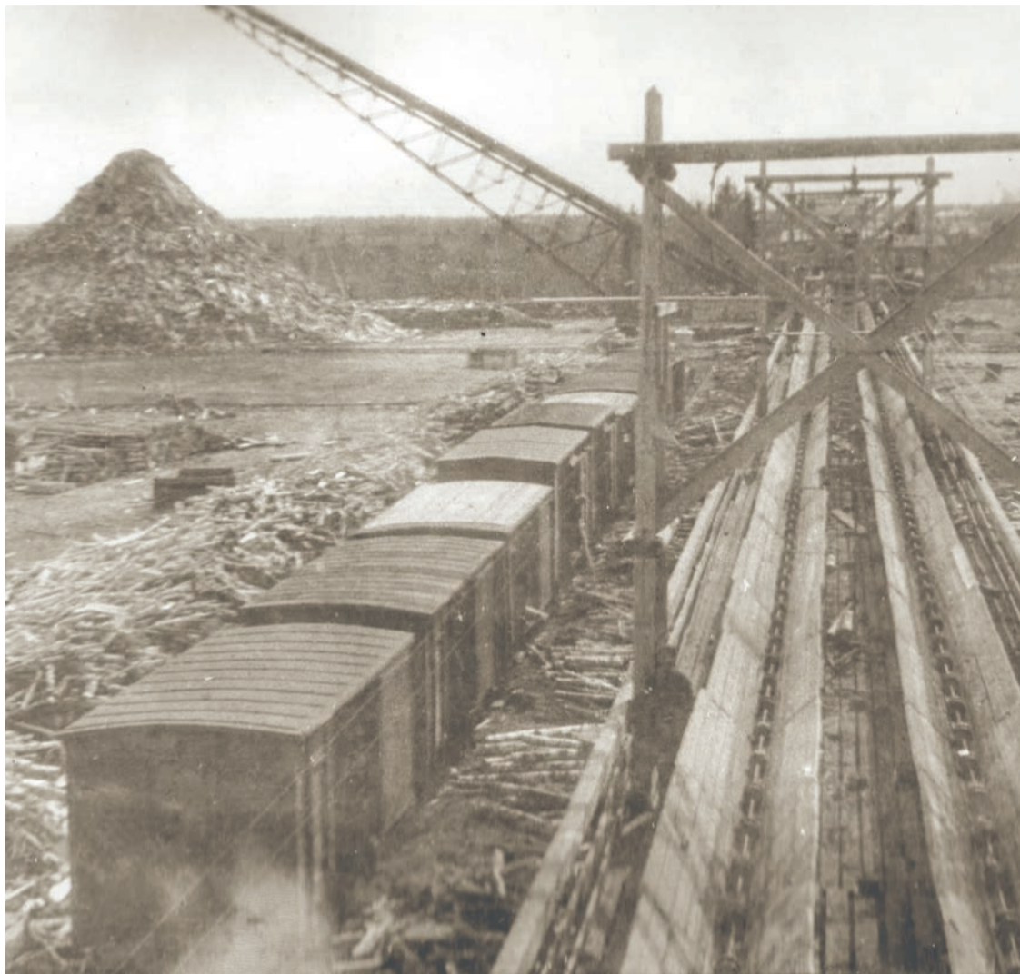
Так выглядела старая лесная биржа Балахнинского бумкомбината в первой половине 20 века. В 1997 году на ее месте был построен современный древесно-подготовительный цех.

Понравилась рубрика? Смотрите больше редких, архивных фотографий в группе АО «Волга» в соцсети ВКонтакте. Чтобы быстро перейти в группу, просканируйте этот QR код: