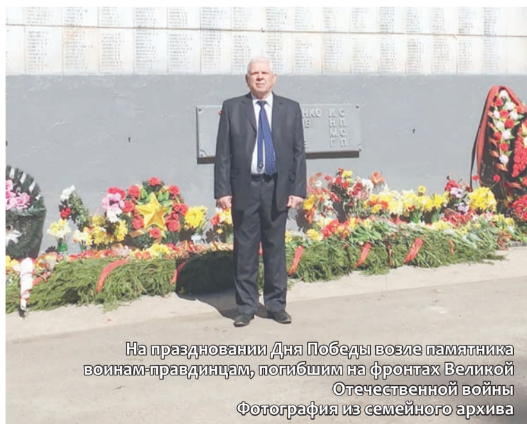
На праздновании Дня Победы возле памятника воинам-правдинцам, погибшим на фронтах Великой Отечественной войны