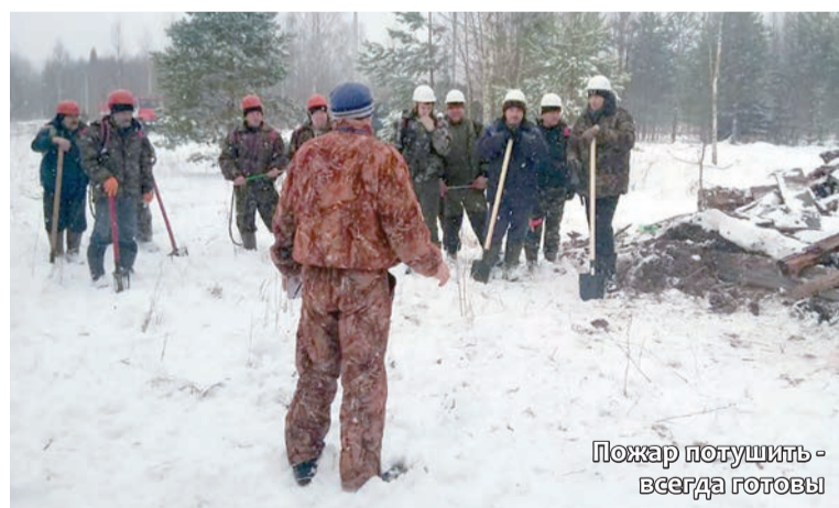
Пожар потушить - всегда готовы