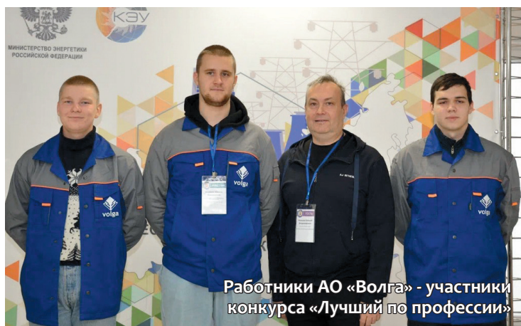
Работники АО «Волга» - участники конкурса «Лучший по профессии»

«Конкурс прошёл на очень серьезном уровне. Особое внимание уделялось правильности и безопасности оперативных переключений в электроустановках. Соревнования рассчитывались для дежурных электромонтеров