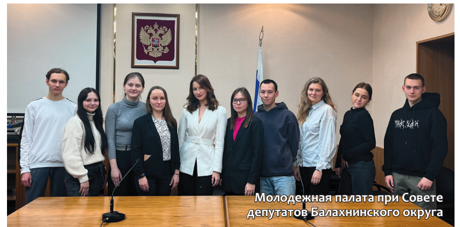
Молодежная палата при Совете депутатов Балахнинского округа

— Мне стало интересно посмотреть на то, что изменилось. Дело в том, что я участвовала в первом созыве молодежной палаты. Раньше она была при земском собрании. Если не ошибаюсь, это были 2007–2008 годы. Тогда мы только начинали. Сейчас мне захотелось продолжить, чтобы понять, что поменялось за эти годы, к чему мы пришли, что нам ещё можно здесь реализовать и вообще, как сейчас все организовано.