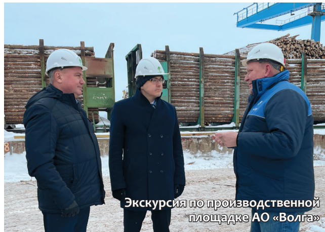
Экскурсия по производственной площадке АО «Волга»

Также он предложил в рамках предстоящего создания рабочей группы, организовать её на площадке Государственной Думы РФ, тем самым создав возможность консолидации проблемных вопросов отраслевых ассоциаций (РАО «БУМПРОМ», Союза лесопромышленников и лесозэкспортёров, Лиги переработчиков макулатуры), связанных с производством предприятий ЦБП, а также их рассмотрения и возмож-