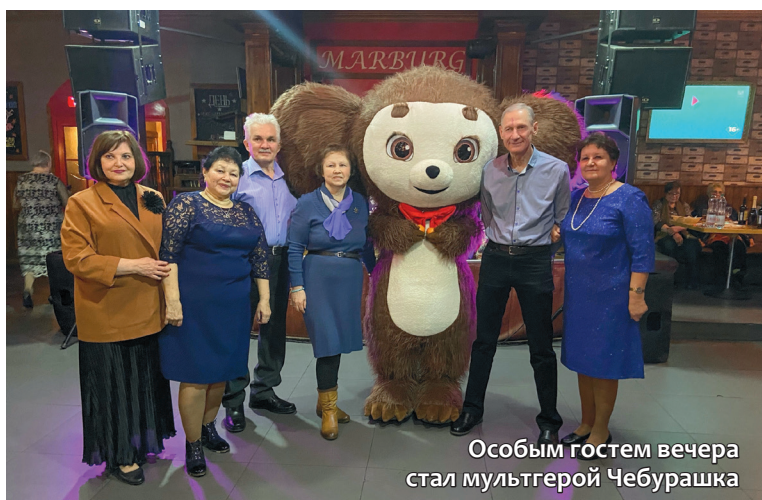
Особым гостем вечера стал мультгерой Чебурашка