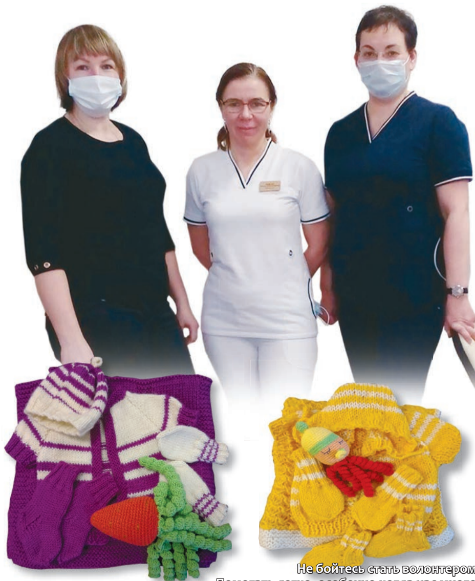
Не бойтесь стать волонтером! Помогать легко, особенно когда нас много!

шенных малышей. Но эта важная помощь по-прежнему нужна. Каждый день и буквально с самых первых секунд после рождения «торопыжек». Ее с радостью ждут не только детки, но и их родители. Не бойтесь стать волонтером. Помогать легко, особенно когда нас много!