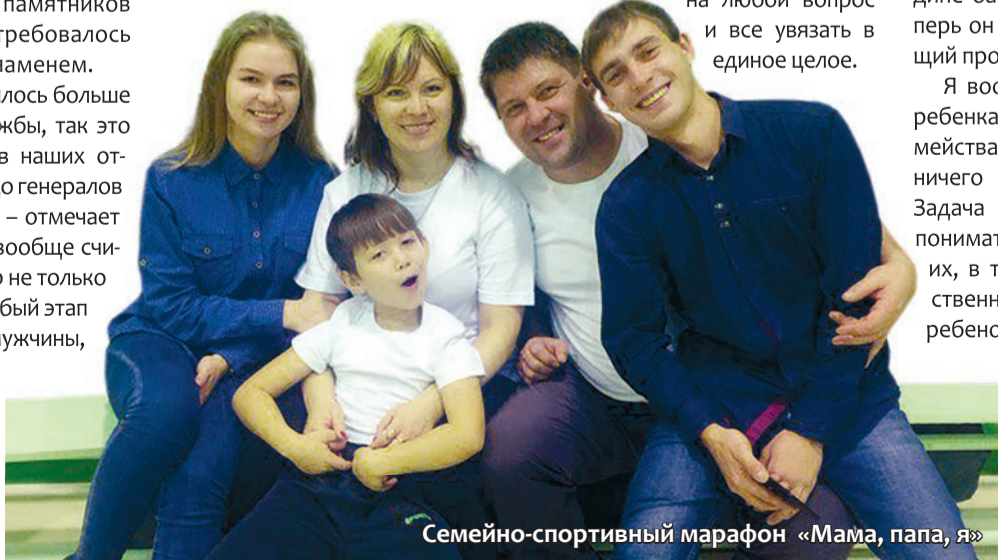
Семейно-спортивный марафон «Мама, папа, я»

ство развивается. А значит и нам приходится осваивать что-то новое, решать принципиально новые задачи. И это действительно увлекает. Хочется найти ответ на любой вопрос и все увязать в единое целое.