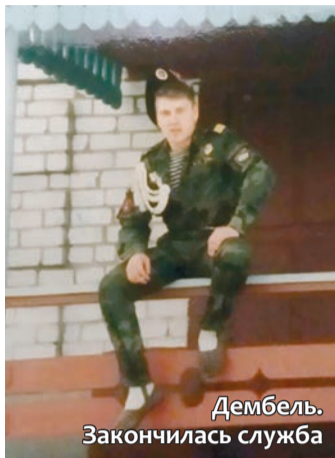
Дембель. Закончилась служба