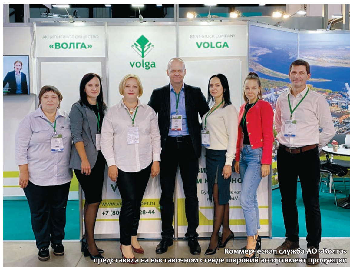
Коммерческая служба АО «Волга» представила на выставочном стенде широкий ассортимент продукции

Международная выставка оборудования и технологий для целлюлозно-бумажной, лесной, перерабатывающей, упаковочной промышленности и отрасли санитарно-гигиенических видов бумаг PulpFor-2022 состоялась в Санкт-Петербурге с 15-17 ноября.