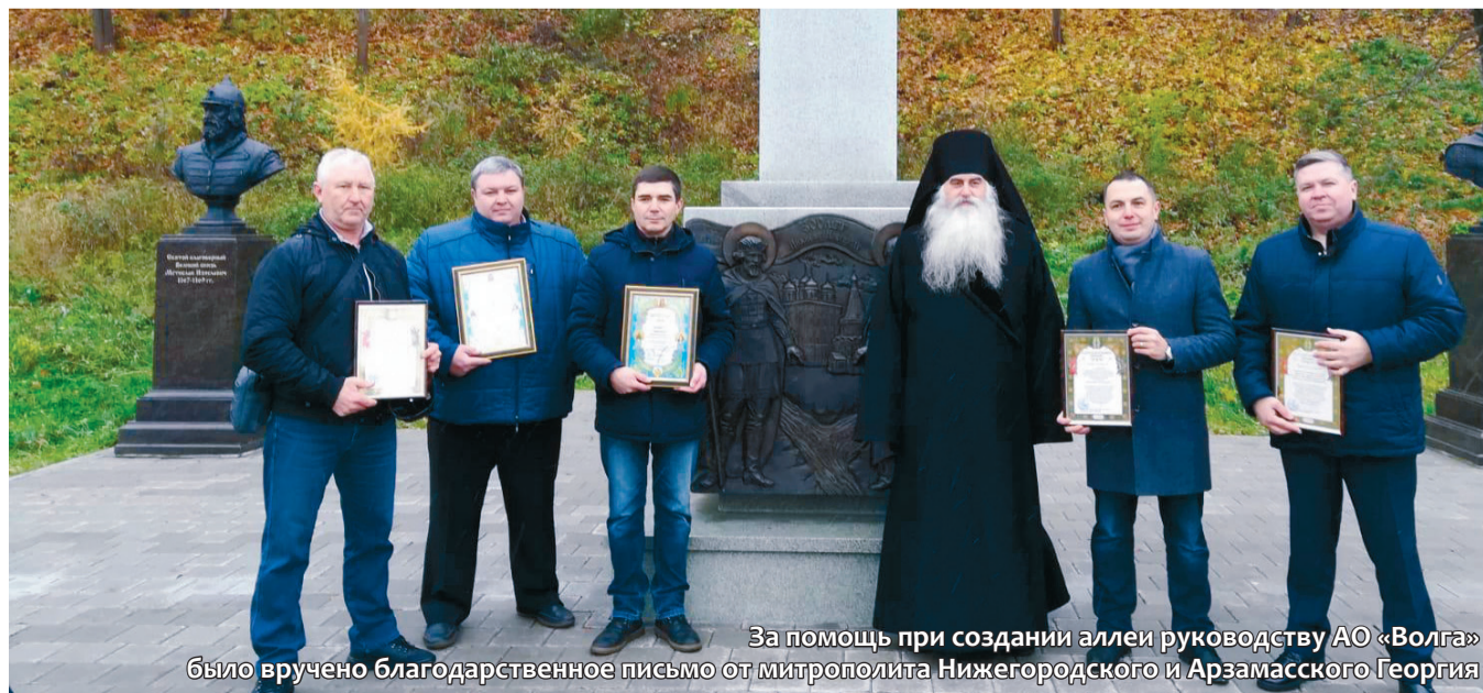
За помощь при создании аллеи руководству АО «Волга» было вручено благодарственное письмо от митрополита Нижегородского и Арзамасского Георгия

В сквере Вознесенского Печерского монастыря появилась аллея с бюстами князей и царей династии Рюриковичей, открытие которой было приурочено ко Дню народного единства. В торжественном открытии аллеи приняли участие Губернатор Нижегородской области Глеб Никитин и митрополит Нижегородский и Арзамасский Георгий.