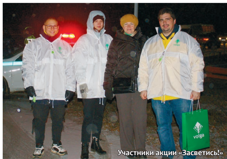
Участники акции «Засветись!»

Осенью в тёмное время суток, особенно в условиях непогоды, риск пешехода попасть в дорожно-транспортное происшествие существенно возрастает, а наша общая задача – научить детей основам безопасности, и мы надеемся, что светоотражатели помогут школьникам стать заметнее на дороге.