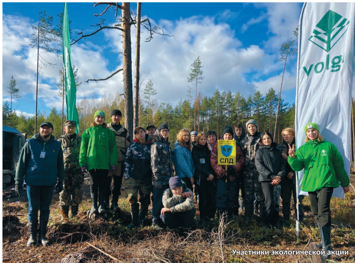
Участники экологической акции