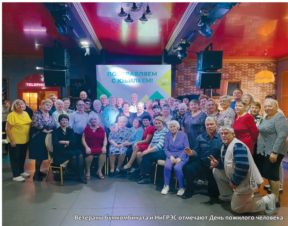
Ветераны бумкомбината и НигРЭС отмечают День пожилого человека