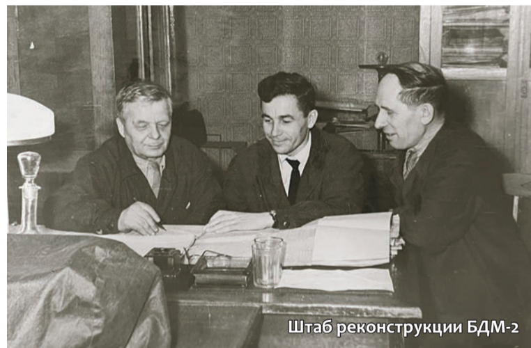
Штаб реконструкции БДМ-2

Сегодня о том времени написано множество исследований, но однозначного мнения о причинах «жестокой встряски» общества так и не определено.